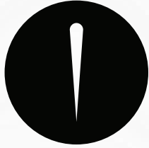
شركة كويزار للحلول التسويقية