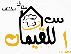
مؤسسة بيت اللقيمات