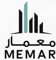
شركة معمار الذكية للتطوير العقاري