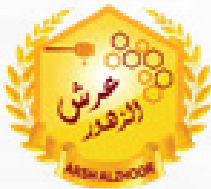
شركة عرش الزهور التجارية