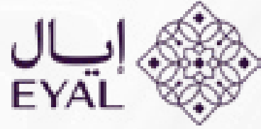
شركة إيال للتطوير العقاري