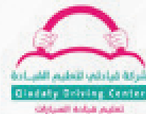
شركة قيادتي لتعليم القيادة